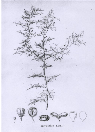
Fonte: Carl Friedrich Philipp von Martius – Flora Brasiliensis , 1861.

Árvore de pequeno a médio porte, é originária da América do Sul, distribuída por todo o Brasil, sendo amplamente utilizada pelas populações nativas para diversos fins, dentre eles os males que acometem o estômago.